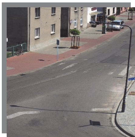
ul.1 Maja przed zmianami...