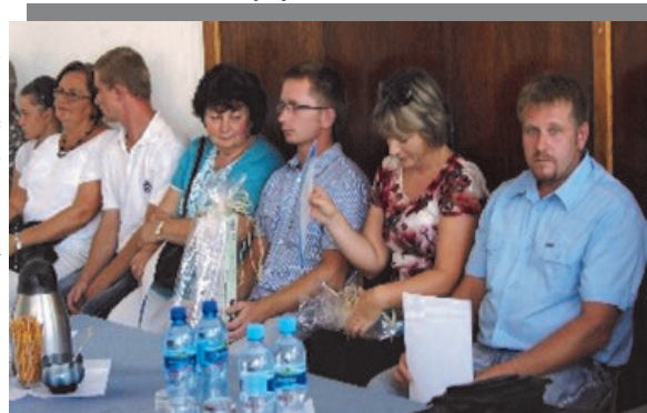
Laureaci konkursu na najładniejszy balkon i przydomowy ogród